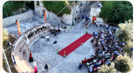
Piazza Don Ugo Della Camera