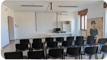
Sala Conferenze Biblioteca Comunale