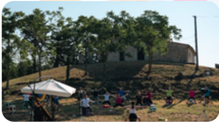
Chiesa San Michele