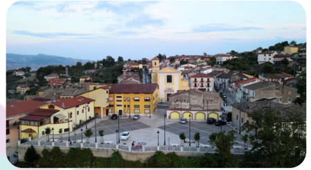
Piazza Madonna del SS. Rosario