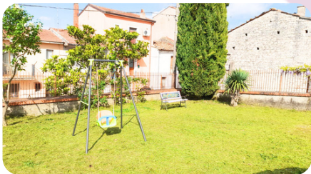
Area Verde Sede Artemide APS