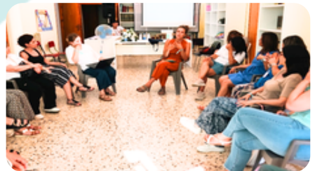
Sede Associazione Artemide APS